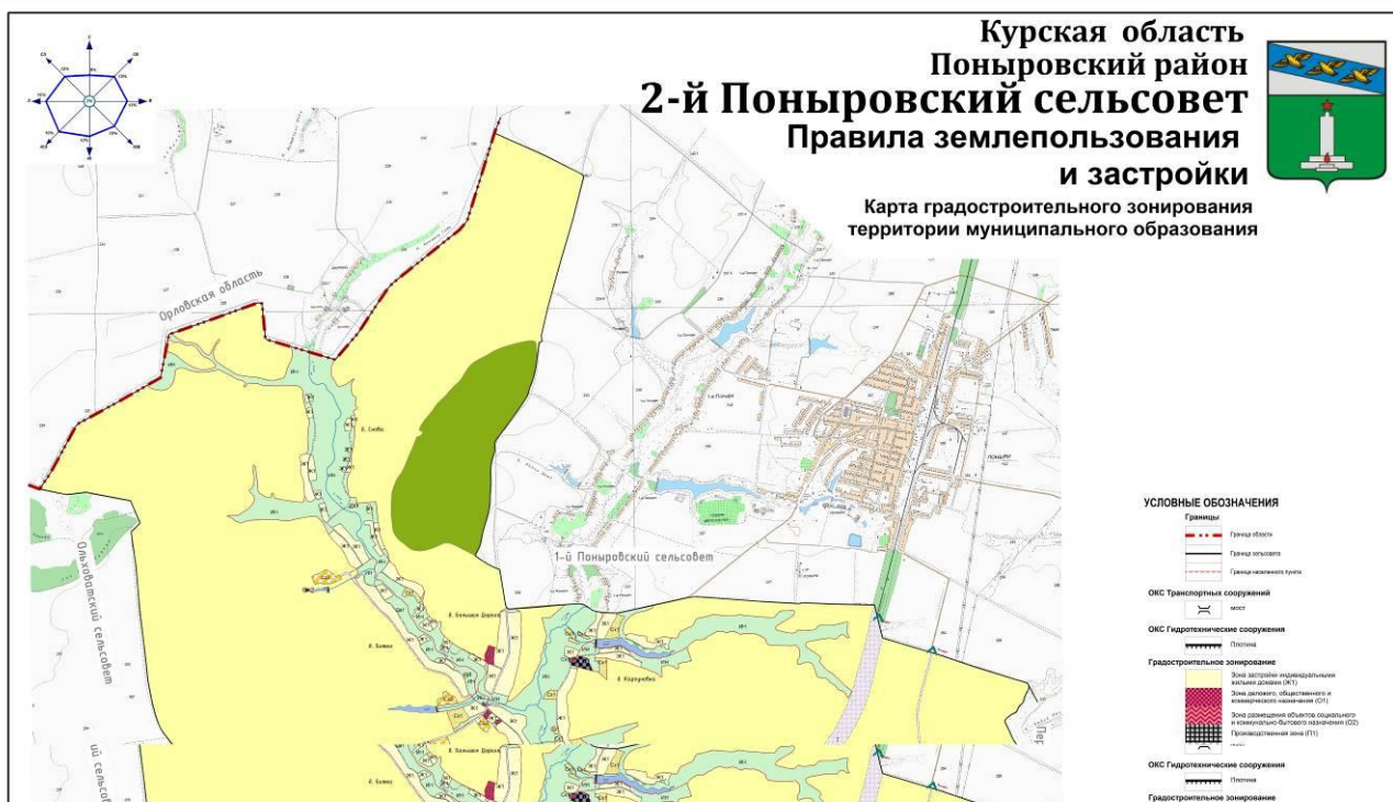
Рис.1. Схема градостроительного зонирования территории муниципального образования «2-й Поныровский сельсовет» Поныровского района Курской области